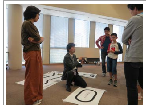
保護者の方も参加した スペースロボット教室