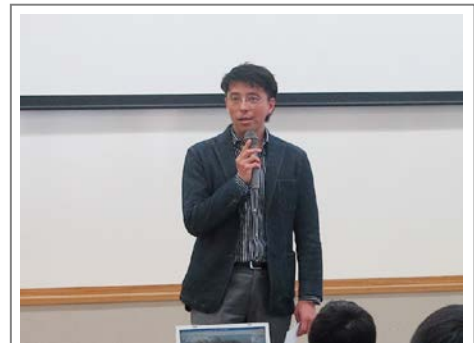
松本部長 閉会あいさつ