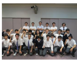
双星高校情報技術部と記念撮影