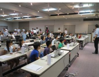
熱心に聴き入る子供たち